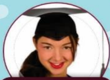
Seguimiento al Egresado y Graduado

A todos los egresados y graduados de la UNH de las distintas carreras profesionales a que se registren en el portal de bolsa de trabajo, sigue los pasos a continuación..